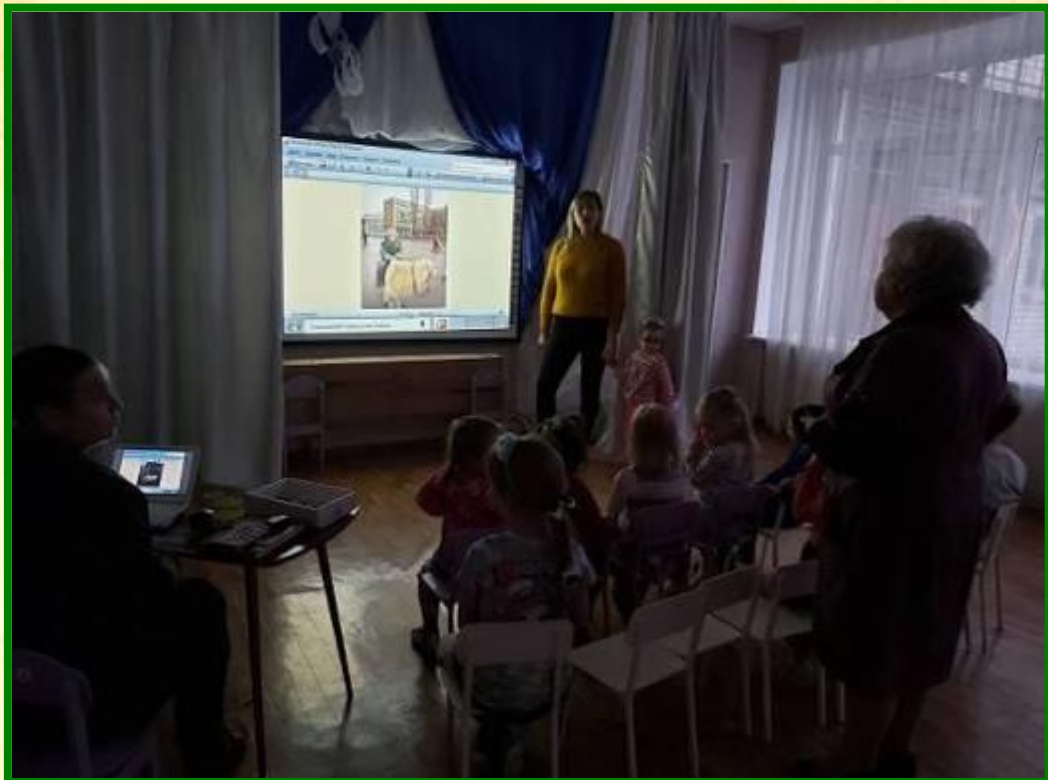
Мы узнаём историю Тракторного завода