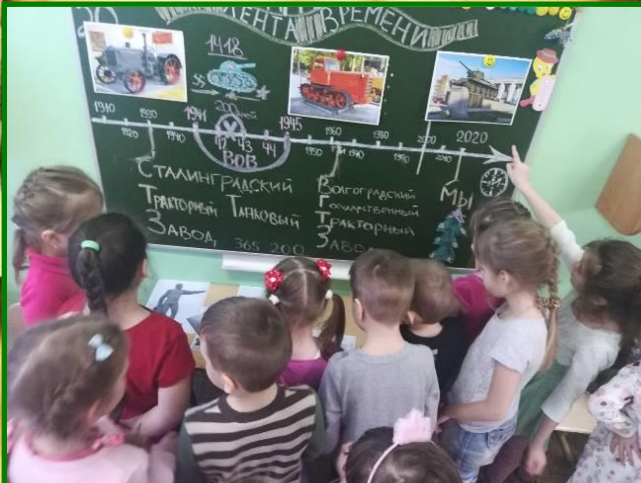
НОД «Лента времени»