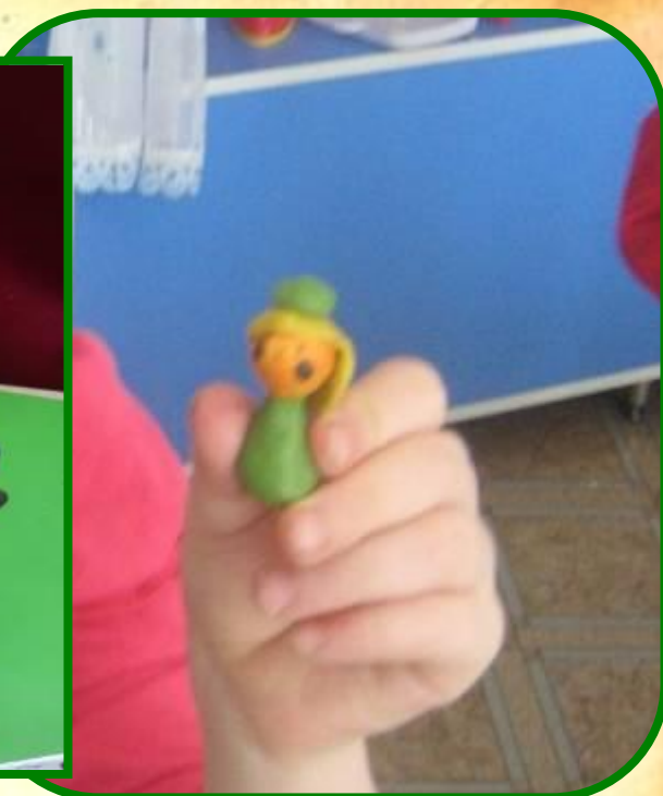
Мы лепим работников завода и защитников