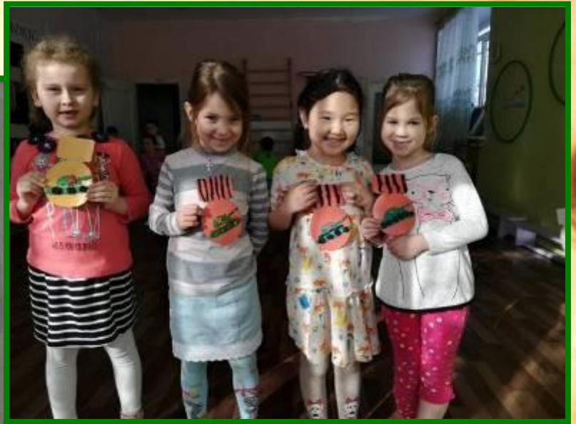
Мы рисуем пластилином