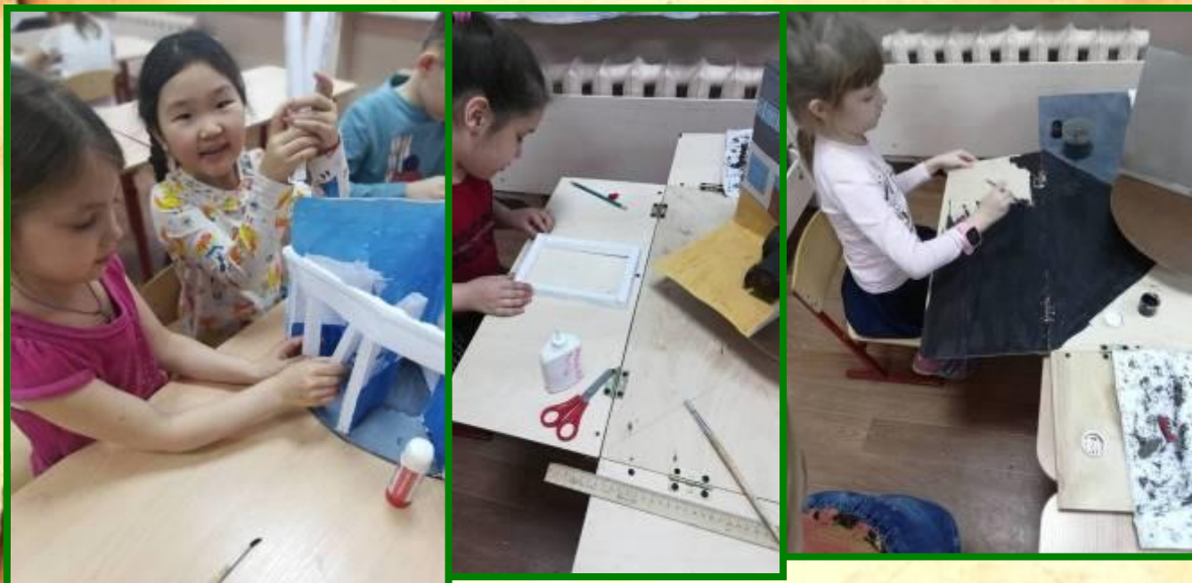
Мы собираем наш макет-конструктор «КОЛЕСО ВРЕМЕНИ»